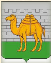
Схема мероприятий по формированию аукционной документации по продаже земельных участков, расположенных на территории города Челябинска, находящихся в муниципальной собственности или государственная собственность на которые не разграничена, или права на заключение договоров аренды таких земельных участков